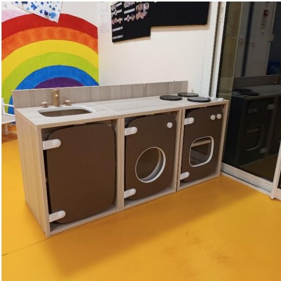
Nouveaux équipements à la micro-crèche