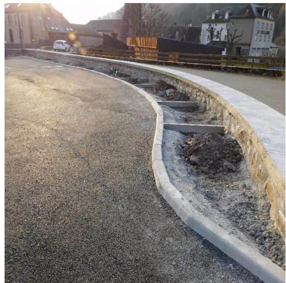
Couronnement du parking école