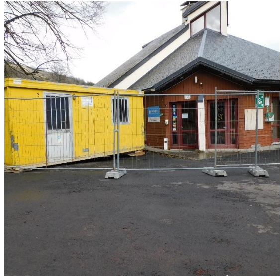
Début des travaux au camping