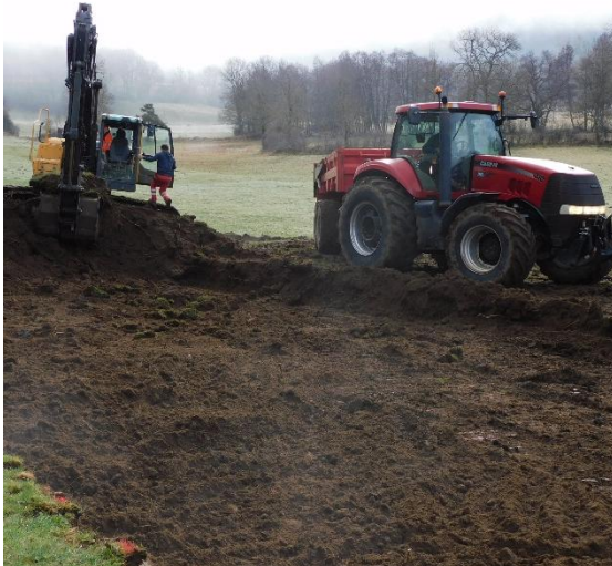
Début des travaux à la STEP